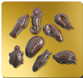
CHOCOLAT NOIR BIO* 56%