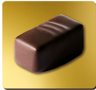
LINGOT DE CHOCOLAT NOIR FOURRÉ GIANDUJA 26% ET PRALINÉ AUX ÉCLATS DE CRÊPE DENTELLE