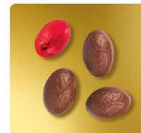
LAIT - FOURRÉ PRALINÉ