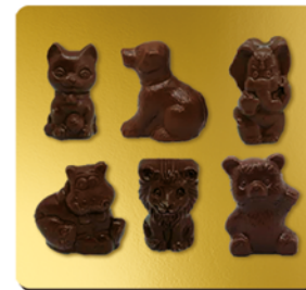
CHOCOLAT NOIR BIO* 70%