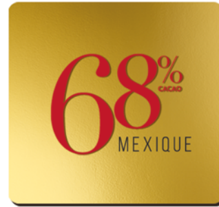
68% DE CACAO ORIGINE MEXIQUE

Terre d'origine du Cacaoyer -les Mayas le cultivaient déjà- le Mexique fourni des fèves qui produisent un cacao puissant et équilibré, avec une pointe d'acidité.