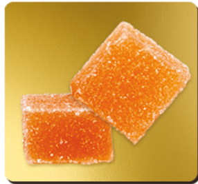
FRUIT DE LA PASSION