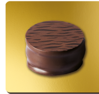
PALET DE CHOCOLAT NOIR INTÉRIEUR GANACHE INTENSE AU CACAO DU VENEZUELA