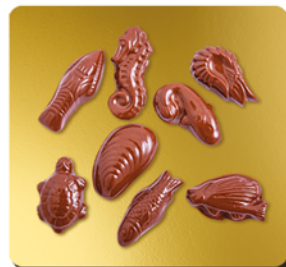
CHOCOLAT LAIT BIO* 41%