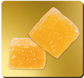
CITRON DE CORSE