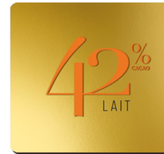
42% DE CACAO LAIT

Ce chocolat apprécie particulièrement les accords avec les épices comme la cannelle, les fruits rouges ou la banane.