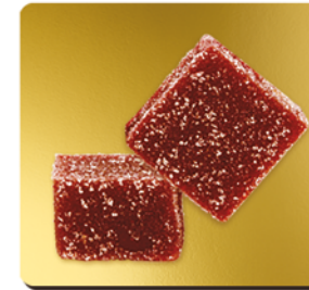
FRAISE MARA DES BOIS