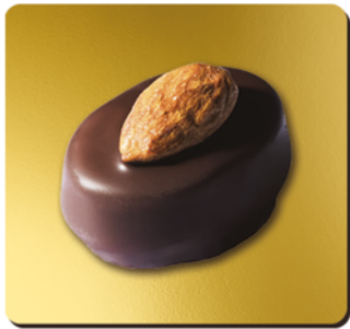
BONBON DE CHOCOLAT NOIR FOURRÉ PRALINÉ AMANDES