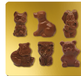
CHOCOLAT LAIT BIO* 41%