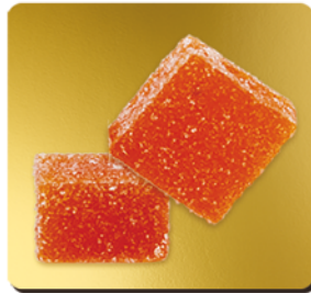
ABRICOT DE LA DRÔME