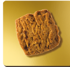
CARAMEL BEURRE SALÉ