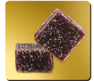
CASSIS DE BOURGOGNE