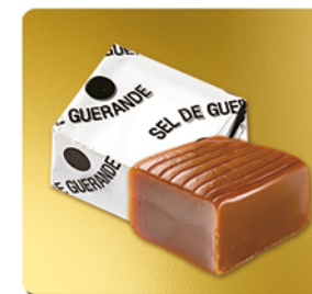
CAMEL SEL DE GUÉRENDE