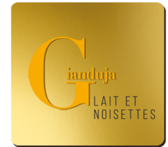
GIANDUJA LAIT ET NOISETTES

Ce chocolat au lait 42% de cacao aime les accords avec le caramel, le spéculos ou la noisette.