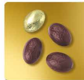
NOIR - FOURRÉ PRALINÉ