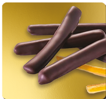
ÉCORCE D'ORANGES CONFITES