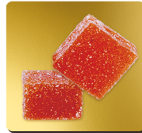
PÊCHE DE VIGNE DE LA DRÔME