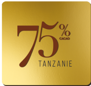
75% DE CACAO ORIGINE TANZANIE

Petit producteur de cacao, la Tanzanie produit des fèves rares mais recherchées pour leur belle puissance aromatique et leur palette d'arômes exceptionnelle.