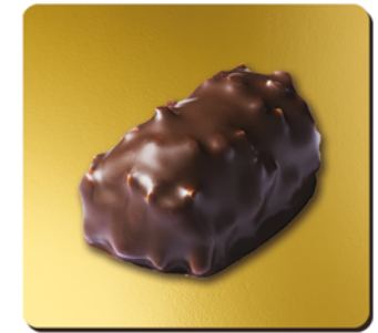
BUCHETTE DE CHOCOLAT NOIR FOURRÉE PRALINÉ, AUX ÉCLATS D'AMANDES VALENCIA