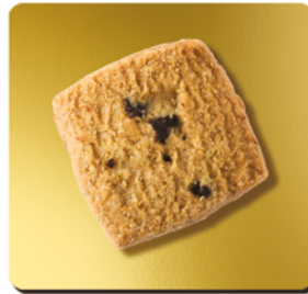
PÉPITES DE CHOCOLAT